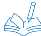
PROZESSGESTALTUNG UND -DOKUMENTATION