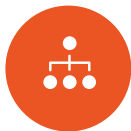
プロセス マッピング