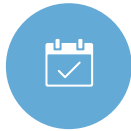
プロジェクト計画