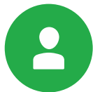
ブレインストーミング

毎日、世界中で何千もの組織で、何百万人もの人々が、考えるため、計画するため、伝えるため、協業のため、重要な業務の遂行をより効率的に行うために MindManager を利用しています。