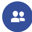
タスクやプロジェクトの管理